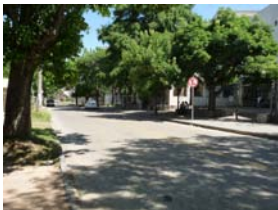
Ciclovia de Facultad de Arquitectura a Facultad de Odontología