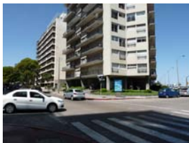
Semáforos en Juan B. Blanco y Buxareo