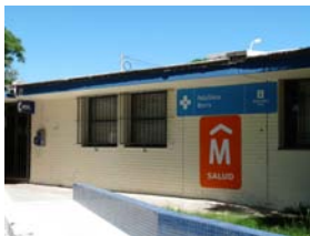
Acondicionar baños públicos de Policlínica Buceo

Descripción: Acondicionamiento y mejora de gabinetes higiénicos