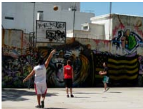
Recuperar Espacio Público para jóvenes

Estado de situación: Proyecto en elaboración