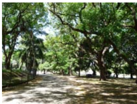
Mejora de senderos del Parque Batlle para practicar deportes