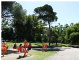
Circuito aeróbico del Parque Batlle