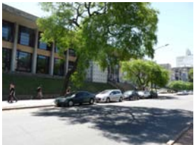
Ciclovia de Facultad de Arquitectura a Facultad de Veterinaria