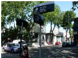
Semáforos en Rivera y Llambí